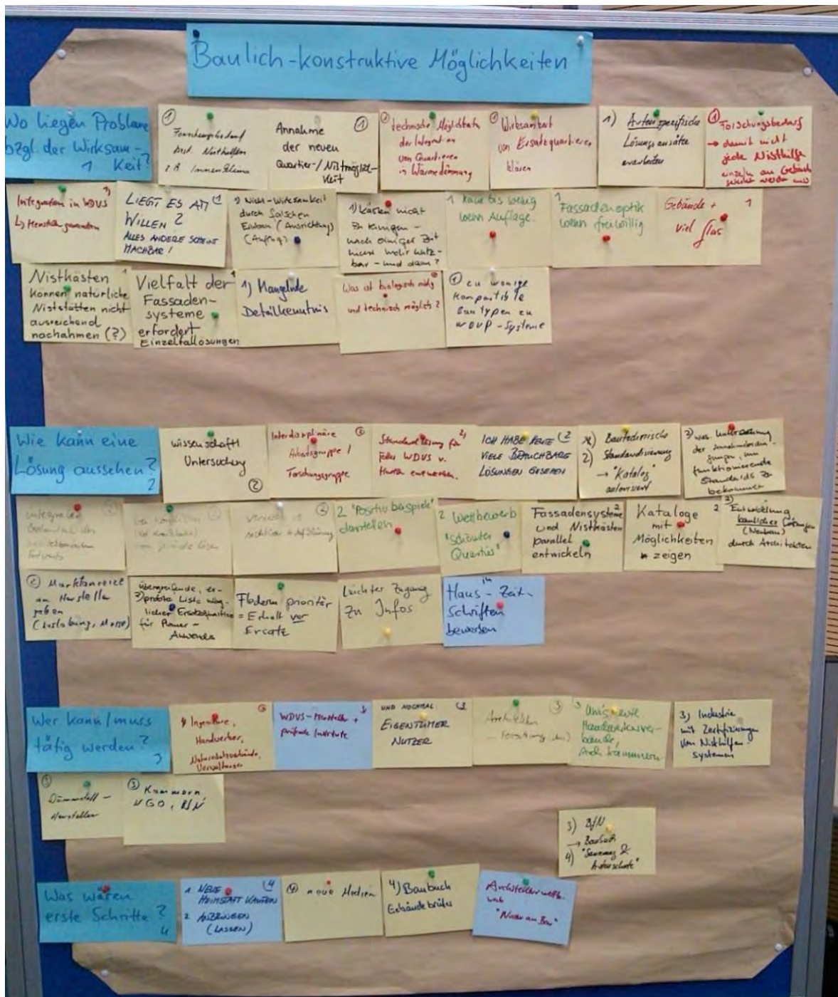
Abbildung 3: Ideensammlung zum Themenblock „Anwendung baulich-konstruktiver Möglichkeiten“

den, sollte nicht ausschließlich von einer hohen Eigenmotivation der Hausbesitzerinnen abhängen, sondern standardisiert angeboten werden. Denkbare „Bastellösungen“ führen nach Meinung der Teilnehmerinnen nicht weiter. Vielmehr sollten fertige Einbausysteme mit Herstellergarantie bezüglich des Einbaus in WDVS forciert werden.